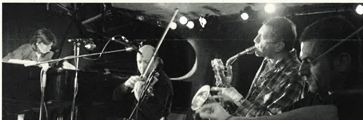
ill. : Gérard Rouy

Laurent Catala, Octopus, revue des musiques libres et inventives